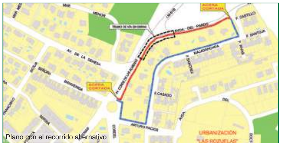
Plano con el recorrido alternativo

La zona se ha señalado para evitar la prohibición del paso y se ha incluido un recorrido alternativo.